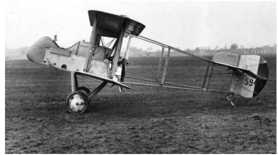
Figura 5 — Modelo Airco DH2 Fonte: Bae Systems

Fonte: Military Aircraft, Origins to 1918: An Illustrated History of Their Impact