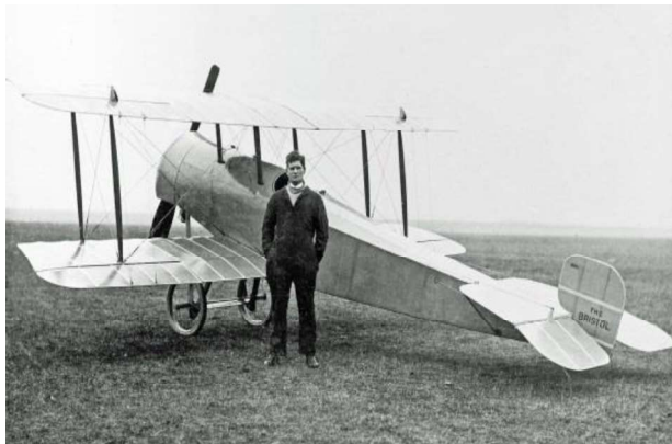
Figura 7 — Aeronave Bristol Scout