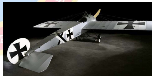
Figura 6 — Aeronave E III

Bristol Scout, foi o primeiro avião utilizado como caça pelo major Lanoe Hawker, esta aeronave utilizava uma metralhadora Lewis para atirar para fora do arco da hélice. Vale ressaltar que a metralhadora Lewis, de fabricação americana, pesava cinco vezes menos que outras metralhadoras utilizadas no período do combate. Dentre suas características, observa-se: