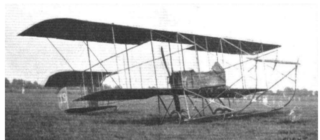
Figura 3 — Maurice Farman MF7