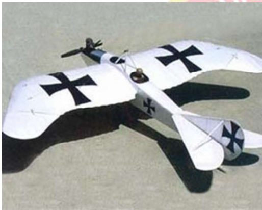
Figura 4 — Rumpler Taube