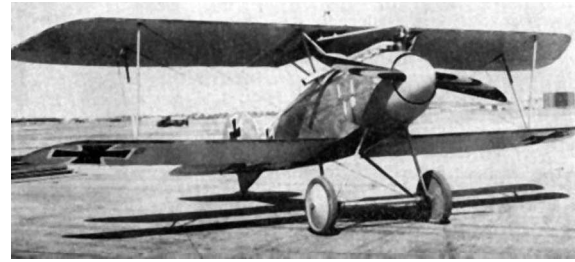
Figura 8 — Aeronave Albatros DIII