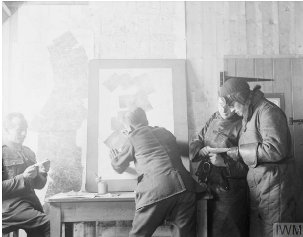
Figura 1 — Série de fotografias aéreas sobrepostas